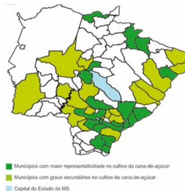
Figura 2. Mapa das regiões de produção de cana-de-açúcar em Mato Grosso do Sul.