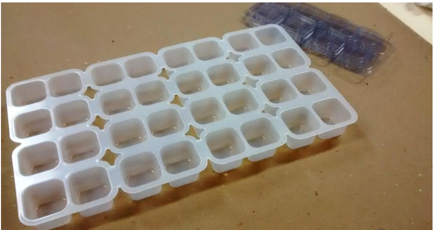
Figura 2: Bandeja de bioensaio com 32 células.