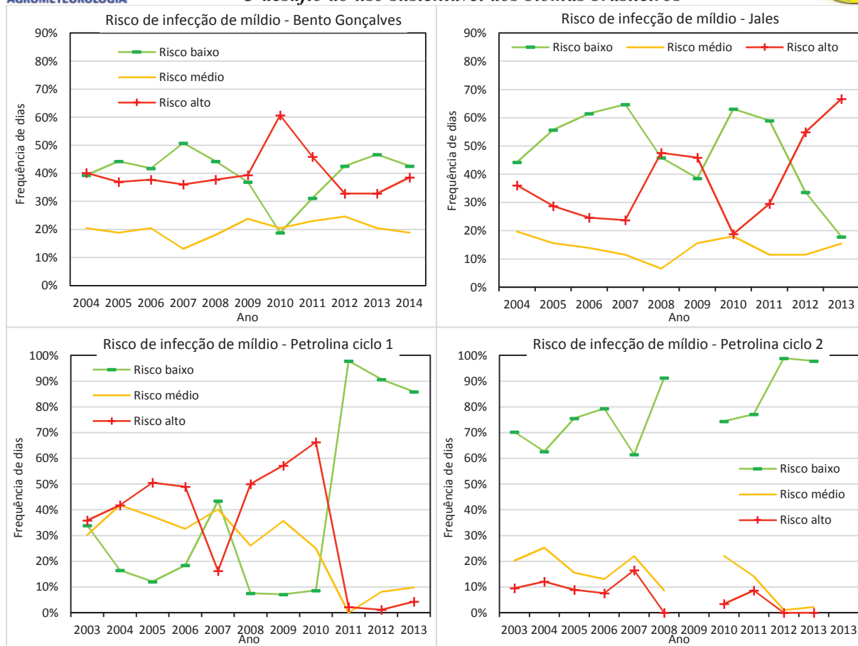
Figura 2. Frequência de ocorrência de dias com risco baixo, médio e alto de infecção de míldio ( Plasmoparaviticola ), em Bento Gonçalves, RS, Jales, SP e Petrolina, PE, calculada durante o período de 2003 a 2014 nos meses iniciais do ciclo da cultura nessas regiões.

A Tabela 1 apresenta o desvio padrão das frequências de dias com risco baixo, médio e alto para míldio nas regiões estudadas. O desvio padrão serve como um indicador da variabilidade que ocorre nessas regiões em termos de condições de favorabilidade para adoença estudada. Neste caso, o indicador mostra se a favorabilidade permanece mais ou menos constante ou se muda muito de um ano para outro.