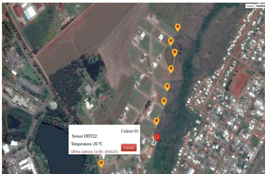
Figura 2 – Ambiente de aplicação e dados coletados

A Figura 2 apresenta os pontos de instalação dos módulos, sendo que a cor amarela, simboliza o estado operante do módulo (identificado por meio de envios temporários), e a cor vermelha indica uma possível falha no sistema (nodo não está enviando nenhum sinal à Central de Controle). Além disso, são exibidas informações dos dados coletados pelo coletor 01, juntamente com a data e horário da última coleta.