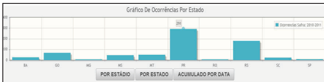
Figura 4 – Gráfico por estado

Existem três tipos de gráficos, um para estado, um para estádio da planta e outro para acúmulo de ocorrências por safra. Quando selecionada uma safra pelo usuário os gráficos mostram os respectivos números de ocorrências ilustrados pelos gráficos.