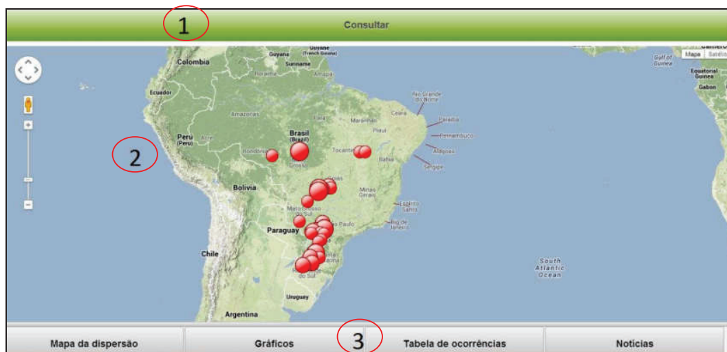
Figura 2 – Tela principal do aplicativo

3. Formas de visualização: Os botões situados na parte inferior tela, definem a forma como as informações serão visualizadas na parte central, que pode ser através do mapa da dispersão, gráficos, tabela e notícias. Tais formas são detalhadas nas subseções seguintes.