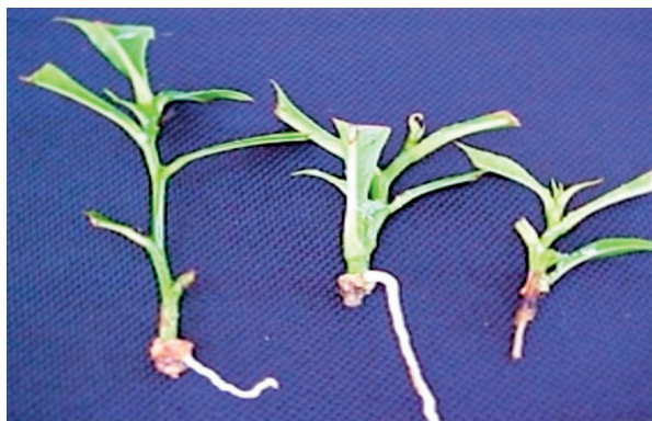
Figura 2. Aspecto de las raíces en los cortes de Bertholletia excelsa a los 180 días.

Las estacas medias sumergidas 1 s a 1000 \text{ mg L}^{-1} de AIB mostraron un porcentaje más alto de enraizamiento (58.3 %), seguida por las estacas basales en el mismo tiempo de inmersión y misma concentración (41.7 %) (Cuadro 1). Sin embargo, estas últimas no difirieron de las estacas medias y basales,