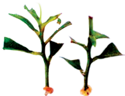
Figura 1. Formación de callo en la base de la estaca de Bertholletia excelsa .

Iritani et al. (1986) and Caldwell et al. (1988) affirm that the roots can appear directly from caulinar tissue or solely through the callus. The formation of calluses must be due to the presence of equilibrium of the auxin applied (IBA) in the presence of an endogenous cytokinin and, according