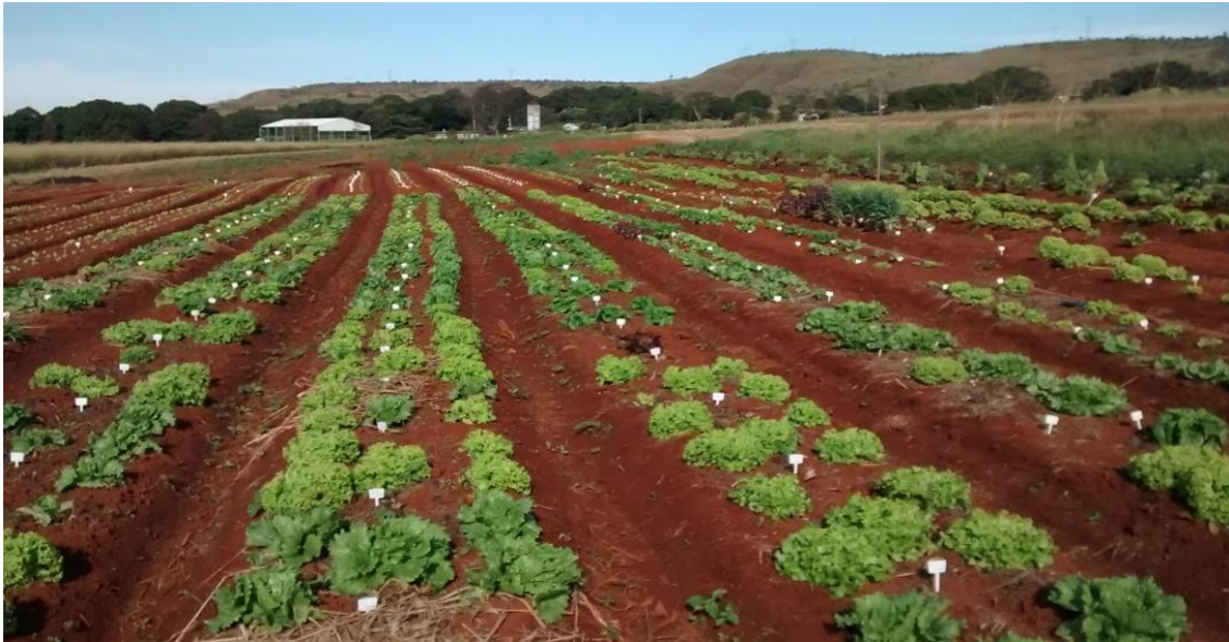
Figura 2 Ensaio em campo (plântio convencional), Embrapa Hortaliças, Brasília-DF.