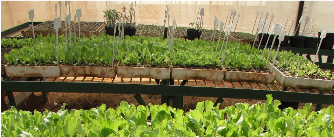
Figura 1. Produção de mudas (Embrapa Hortaliças, Brasília-DF).