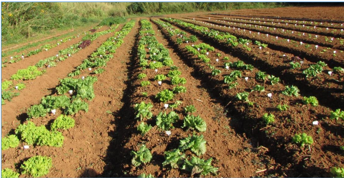
Figura 3 Ensaio em campo (plântio orgânico), Embrapa Hortaliças, Brasília-DF.