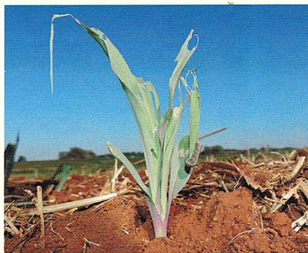
Planta de milho sob ataque da lagarta Spodoptera cosmíodes

As espécies Dichelops melacanthus e D. furcatus são relatadas como constituintes do complexo de pragas secundárias da soja em