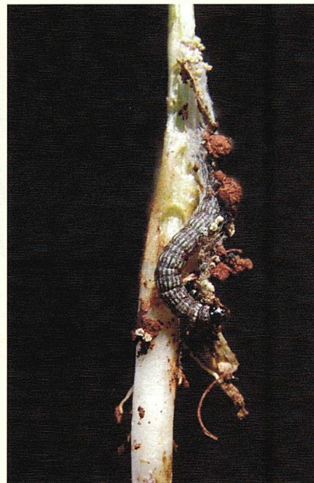
A lagarta-elasma pode danificar plantas jovens, quando já estiver presente na cobertura dessecada

várias regiões do Brasil. Todavia, em 1993 foi relatada pela primeira vez no Brasil a ocorrência de D. melacanthus causando danos em plântulas de milho no município de Rio Brillante, MS (Ávila & Panizzi, 1995). Desde então, as espécies D. melacanthus e D. furcatus , em ocorrência simultânea ou não, têm sido encontradas em lavouras de milho do Brasil. O inseto apresenta a parte dorsal marrom e a ventral verde, daí o nome barriga-verde. Os ovos, de coloração verde-azulada, são colocados sobre as folhas do milho ou até mesmo de plantas daninhas. Durante a alimentação, esses percevejos posicionam-se, normalmente, no sentido longitudinal da planta, com a cabeça orientada para a região do colo. Se, no processo de alimentação, o meristema apical for danificado, as folhas centrais da plântula murcham e secam, manifestando o sintoma denominado “coração morto”, podendo também ocorrer o perfilhamento da planta. Quando o meristema apical não é danificado, as primeiras folhas que se desenrolam do cartucho apresentam estrias esbranquiçadas transversais, muitas vezes com perfurações