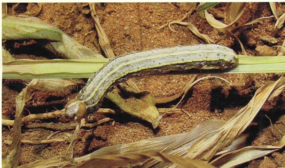
Presença de lagarta Spodoptera frugiperda em área de cultivo de milho

As lesmas e os caracóis são moluscos da classe Gastropoda, que ocorrem com maior frequência em ambientes úmidos e frescos. As lesmas apresentam o corpo nu, mas os caracóis carregam sobre o seu dorso uma capa ou concha de carbonato de cálcio, que lhe confere abrigo e proteção. Estes organismos são muito sensíveis à desidratação e nos períodos secos ficam inativos enterrados no solo ou sob a palhada de lavouras implantadas em semeadura direta. Essas pragas apresentam maior abundância em solos com elevada quantidade de palha ou de matéria orgânica e têm forte associação com plantas do grupo das leguminosas e crucíferas (exemplo feijão, soja, ervilhaca, nabo-forageiro, serralha etc). Os ovos das lesmas e dos caracóis são colocados geralmente em grande número nas fendas do solo ou sob restos vegetais em processo de decomposição.