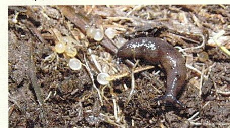
Lesmas alimentam-se das folhas das plântulas de milho e causam injúrias semelhantes às dos insetos

Crébio José Ávila, Embrapa Agropecuária Oeste Silvestre Bellettini, Uenp/CLM