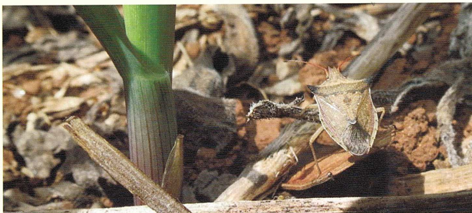
O percevejo barriga-verde ( Dichelops melacanthus ) tem sido encontrado em lavouras de milho no Brasil há vários anos

Tanto as lesmas quanto os caracóis alimentam-se das folhas das plântulas de milho, sendo as injúrias semelhantes a aquelas causadas por insetos. Em Mato Grosso do Sul, as espécies de caracóis e lesmas encontradas na cultura domilho foram identificadas, respectivamente, como Drymaeus interpunctus (Molusca: Bulimulidae) e Sarasimula linguaeformis (Molusca: Veronicellidae).