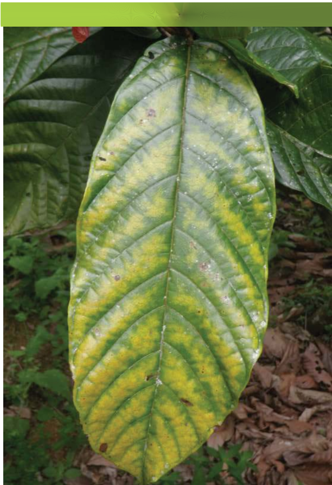
Deficiência de magnésio em cacaueteiro pag. 17.

12º curso de Nutrição de Eucalipto pag 23