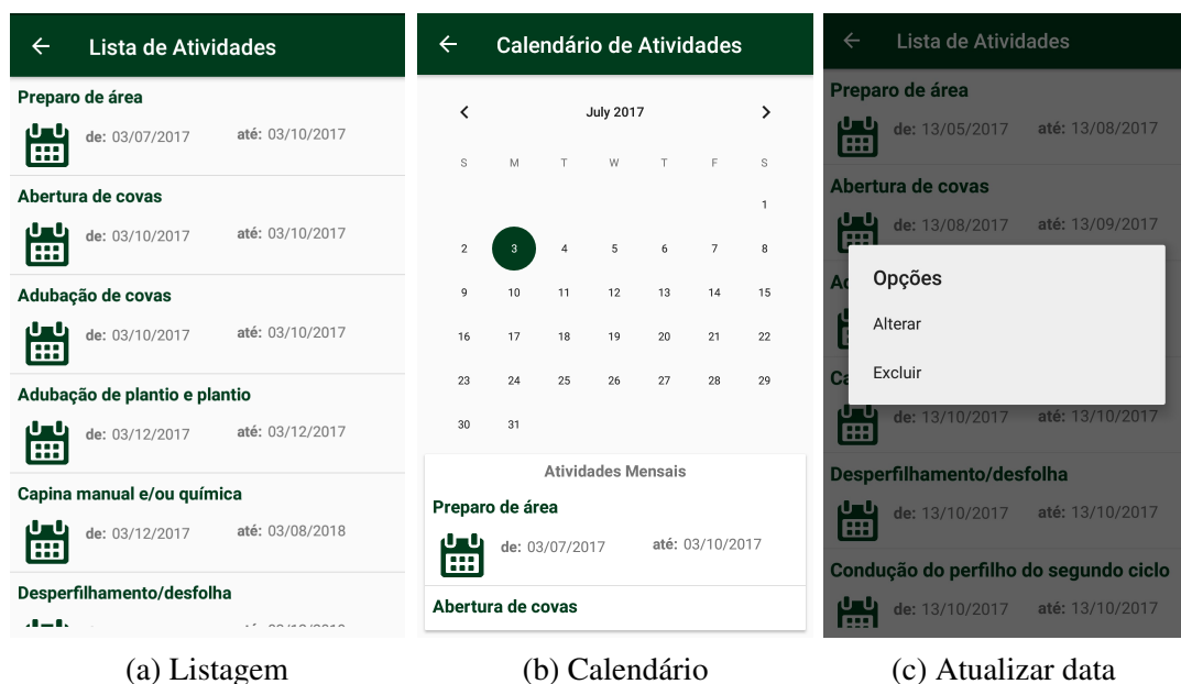
Figura 3: Formas dinâmicas de apresentação das atividades cronológicas e tela de atualização das datas efetivas.

Outra funcionalidade importante do aplicativo é o alarme. Como as culturas do guaraná e da banana possuem um longo período de manejo e produção, poderia ter o risco do produtor rural esquecer da data de determinada tarefa. De forma a mitigar esse risco, foi introduzido no aplicativo uma forma de lembrar as datas recomendadas dessas atividades. O alarme acontece em dois momentos, em primeira instância o usuário é notificado um (01) dia, ou vinte e quatro (24) horas, antes da realização da atividade, e em segundo momento, no dia da realização da atividade.