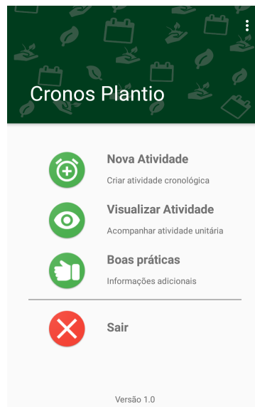
Figura 2: Telas para cadastro e listagem de registros cronológicos.