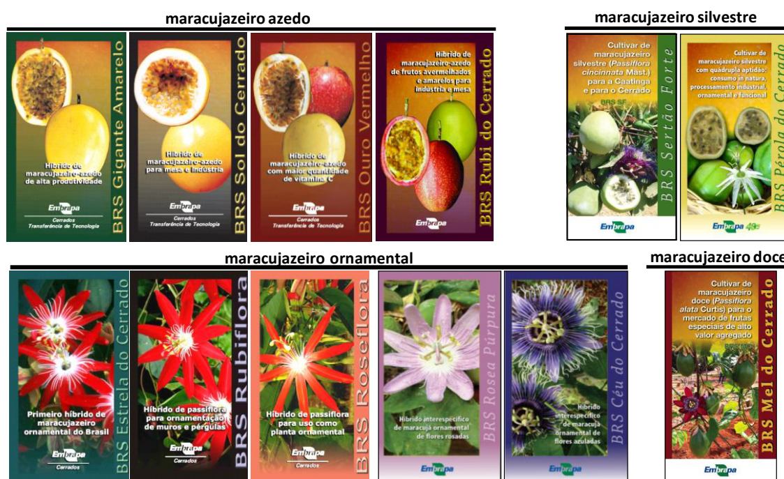
Figura 2. Cultivares de maracujazeiro lançadas pela Embrapa Cerrados e parceiros: maracujazeiro azedo, P. edulis : BRS Gigante Amarelo (BRS GA1), BRS Sol do Cerrado (BRS SC1), BRS Ouro Vermelho (BRS OV1) e BRS Rubi do Cerrado (BRS RC); maracujazeiro ornamental: BRS Estrela do Cerrado ( P. coccinea X P. setacea F1), BRS Rubiflora ( P. coccinea X P. setacea RC1), BRS Roseflora ( P. setacea X P. coccinea RC1), BRS Céu do Cerrado ( P. edulis X P. incarnata RC1) e BRS Rosea Púrpura ( P. incarnata X ( P. quadriflora X P. setacea )); maracujazeiro silvestre: P. setacea BRS Pérola do Cerrado (BRS PC) e P. coccinnata BRS Sertão Forte (BRS SF) e maracujazeiro doce: P. alata BRS Mel do Cerrado (BRS MC).

a qual apresenta pelo menos 3 aptidões para consumo in natura , ornamental e funcional-medicinal (Figura 2).