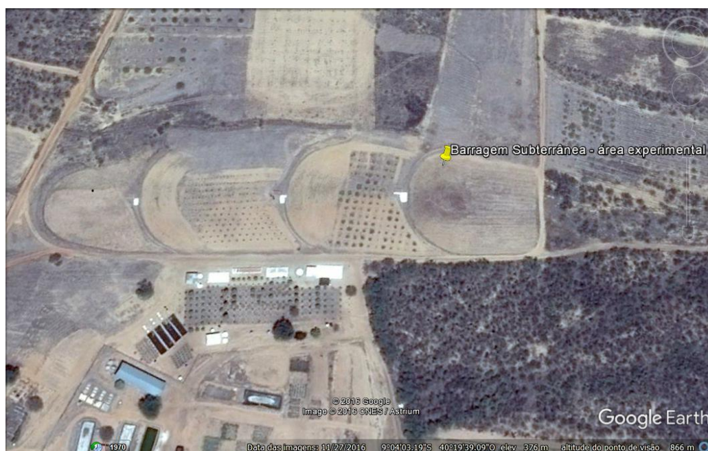
Figura 1. Vista aérea da barragem subterrânea na Embrapa Semiárido, Petrolina – PE.

O experimento foi conduzido em regime de sequeiro, em barragem subterrânea localizada no Campo Experimental da Caatinga, pertencente à Embrapa Semiárido, município de Petrolina, PE, cujas coordenadas são 9° 4'1.18"S e 40° 19'39.39"W (Figura 1).