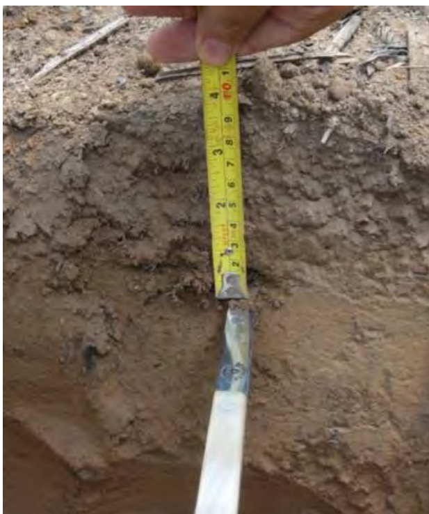
Figura 1. Perfil cultural de parcela demonstrativa de tecnologia de cultivo de algodão no norte de Mato Grosso mostrando camada compactada.

A estratificação vertical do perfil cultural, que no sistema plantio direto passou a substituir a antiga camada arável homogênea, foi avaliada mediante a descrição de perfis culturais pelo método de Tavares Filho et al. (1999), mostrado na Figura 1, em parcelas de uma unidade de referência tecnológica e econômica (URTE Algodão) em Ipiranga do Norte, MT. Os resultados da estratificação dos atributos físicos e químicos estão apresentados nas Tabelas 1 a 3.