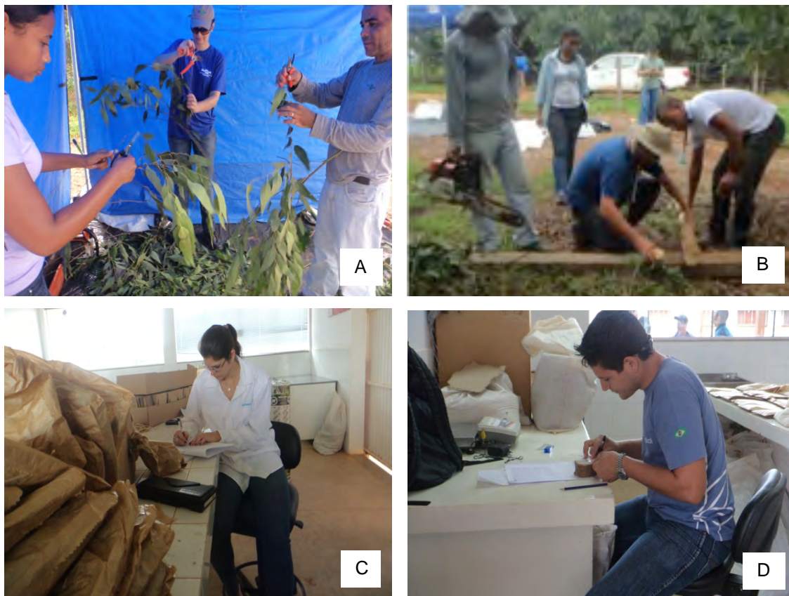
Figura 1. Estudo da partição da biomassa do Eucalipto. Separação e pesagem dos componentes no campo (A); extração dos discos de madeira (B); pesagem das amostras em laboratório (C); estudo do deslocamento da medula (D).

A coleta dos dados foi realizada em janeiro de 2014 (Figura 1), estando às árvores com 25 meses de idade. Para a seleção de árvores amostras, utilizou-se o intervalo de confiança da média dos diâmetros a altura do peito (DAP), obtidos com base no inventário florestal contínuo da área.