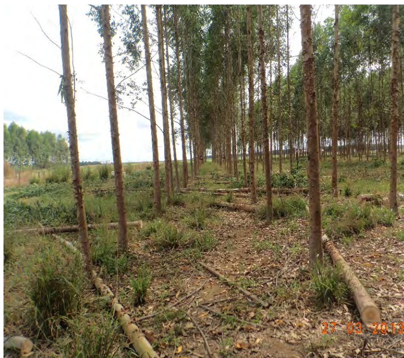
Figura 1. Primeiro desbaste seletivo com remoção de 50% das árvores, realizado no ILPF aos 5 anos, Sinop, MT.

O desbaste é uma das principais ferramentas utilizadas no manejo de espécies florestais. Tem como finalidade interferir na competição entre árvores e concentrar a produção, em termos de incremento, nas árvores que constituirão o corte final (Schneider; Schneider, 2008), e em sistemas de integração, deve também ter por objetivo controlar a competição entre as espécies florestais e os cultivos agrícolas de forma a maximizar a produtividade e a rentabilidade global do sistema (Figura 1).