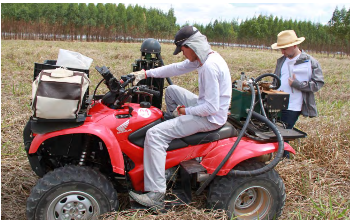
Figura 1. Coleta de amostras de solos na área experimental do ILPF corte.

Após a coleta em todos os tratamentos, as amostras foram dispostas em bancada onde foram secas ao ar e peneiradas em malha de 2 mm, caracterizando a chamada terra fina seca ao ar (TFSA). Os teores de C e N foram quantificados através de analisador CHN (Vario Macro, Elementar Analysensysteme), sendo os estoques calculados em função da profundidade e da densidade do solo. O total de C e N acumulado (estoque) em cada camada dos perfis do solo foi calculado multiplicando-se a massa de solo contida na camada de solo pelo teor percentual de C total, e N total, pela densidade e espessura da camada de solo, deduzindo-se os percentuais de cascalho existente no solo. Os valores dos estoques foram corrigidos pelo método do equivalente de massas, conforme descrito em Sisti et al. (2004).