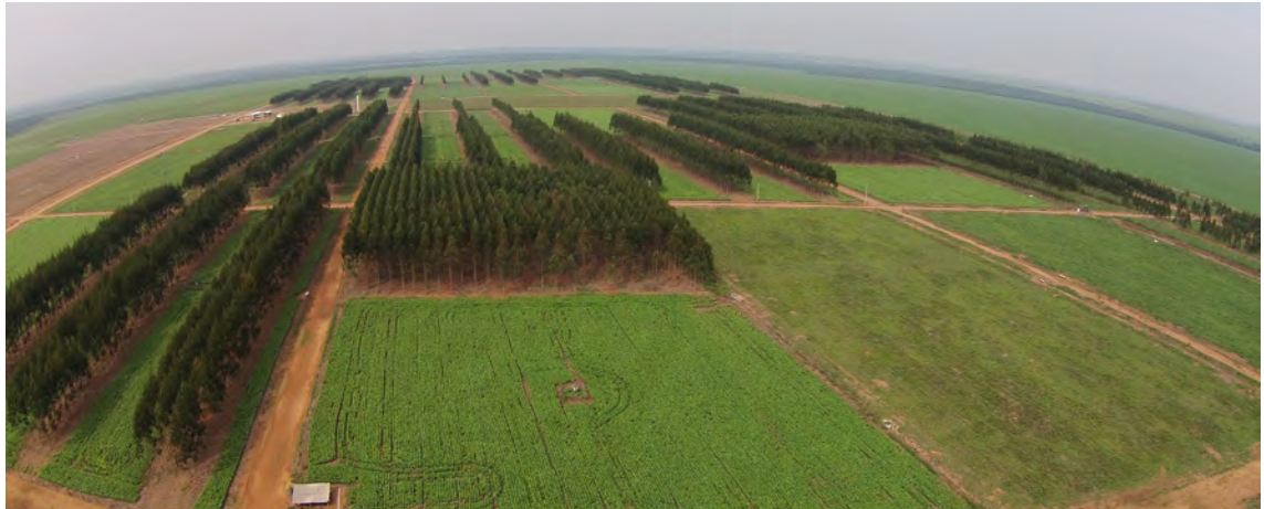
Figura 1. Vista aérea dos sistemas de integração lavoura-pecuária-floresta, campo experimental Embrapa Agrossilvipastoril, 2017.