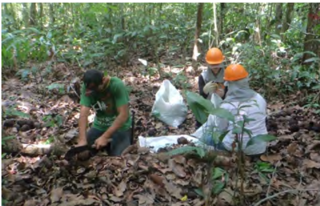
Figura 1. Parte da equipe de trabalho em atividade de monitoramento da produção de frutos em floresta nativa.

Durante o período de queda dos frutos (novembro a março) todas as árvores foram visitadas em pelo menos duas ocasiões na metade e no final deste período, sendo monitoradas 331 árvores por 5 anos e quatro safras 2012/2013; 2013/2014; 2015/2016; 2016/2017 (Figura 1). A estimativa de produção média de sementes por classe diamétrica foi obtida pela abertura e pesagem de 30% dos frutos em cada árvore, considerado como suficiente para um erro amostral de 10% (Tonini, 2013). Posteriormente, em laboratório, foi determinado o teor de umidade das sementes.