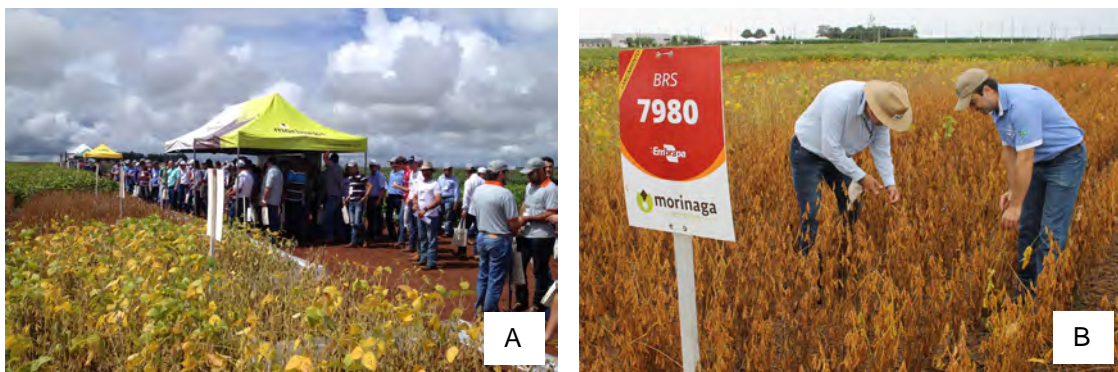
Figura 3. Atividades de transferência de tecnologia em Mato Grosso.

Outra atividade que é desenvolvida em Mato Grosso é a de transferência de tecnologia para o produtor, por meio de palestras e dias de campo. Temos participado ativamente no processo de divulgação das cultivares já lançadas e de todo o portfólio da Embrapa nas principais feiras agrícolas de Mato Grosso, bem como em fazendas, eventos diversos, e na Embrapa Agrossilvipastoril, em sua Vitrine Tecnológica. Nesses eventos (Figura 3), são demonstradas as características mais importantes de cada cultivar, indicando suas potencialidades, qual seu correto posicionamento, indicando as épocas e densidades mais indicadas para a semeadura, além de indicações quanto aos tratos culturais. Nessas últimas safras, pela qualidade das cultivares ofertadas, observou-se um crescimento no cultivo de algumas cultivares e interesse das sementeiras em multiplicar sementes da Embrapa em Mato Grosso, trazendo impactos positivos para o setor.