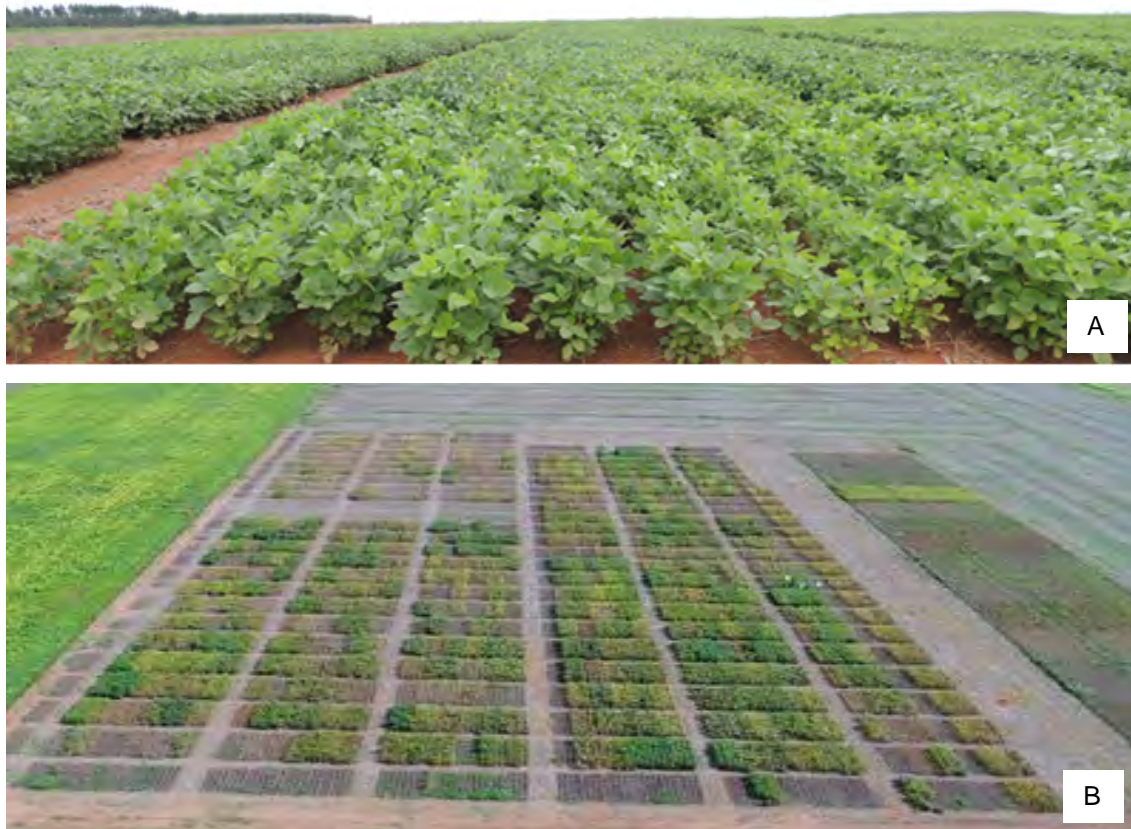
Figura 2. A: Parcelas para avanço de geração pelo método de Bulks. Sinop-MT, 2016. B: Condução de parcelas para avanço de geração pelo método de Bulks. Sinop, MT, 2018.

Por uma ou duas gerações, as parcelas são conduzidas na Embrapa Agrossilvipastoril, em Sinop, MT (Figura 2a e 2b) e, posteriormente, são enviadas sementes para a Embrapa Cerrados, em Planaltina, DF, para que sigam as etapas do melhoramento genético. São realizadas seleções dentro de cada uma das parcelas, buscando-se plantas com padrões agrônômicos desejados, que apresentem porte e ciclo adequados, além de outras características específicas, como resistência a nematoides, doenças etc. Pretende-se, num futuro próximo, que todas as etapas sejam realizadas na Embrapa Agrossilvipastoril, em Sinop, MT, não necessitando-se enviar as sementes para outras unidades, tornando-a uma nova base de melhoramento genético da Embrapa. Esta mudança é de fundamental importância, visto que sua localização estratégica é fundamental para a seleção de cultivares adaptadas ao cerrado brasileiro, tanto para o Mato Grosso, como para locais com menores latitudes, como o polígono MATOPIBA (Maranhão, Tocantins, Piauí e Bahia).