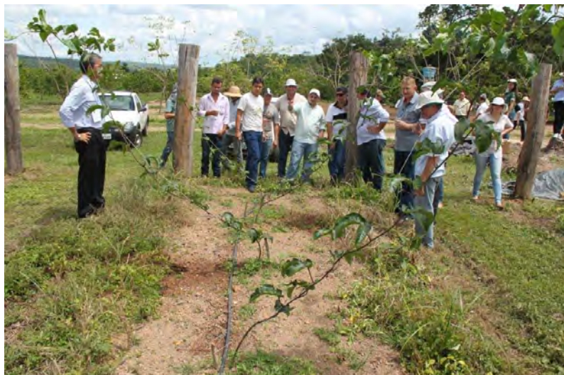
Figura 2. Implantação de unidade demonstrativa de cultivares de maracujazeiro amarelo durante o curso de Capacitação Continuada em Fruticultura Módulo 2.