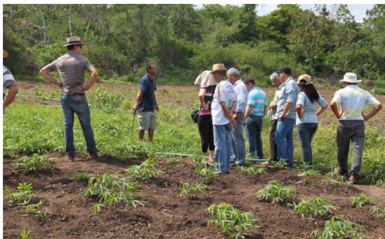
Figura 1. Curso de Capacitação Continuada em Mandioca Módulo 2, atividade prática.