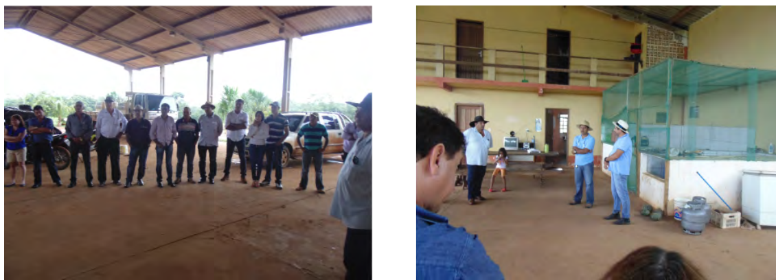
Figura 3. Produtores de Colíder na empresa Piscicultura Amazonas, em Lucas do Rio Verde.