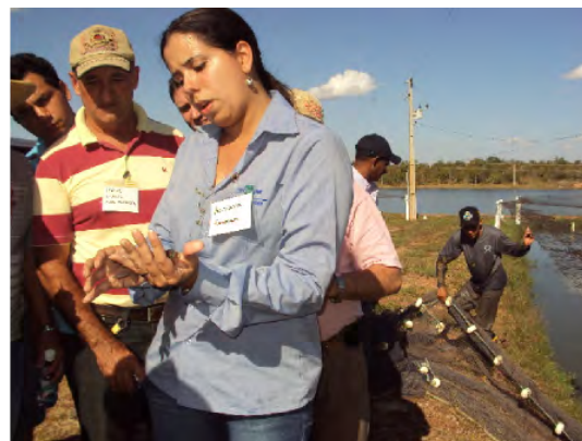
Figura 1. Parte teórica da aula de produção intensiva de tambaqui, ministrada por pesquisadores da Embrapa Amazônia Ocidental (à esquerda); aula prática de biometria de peixes, ministrada por pesquisadora da Embrapa Pesca e Aquicultura (à direita).