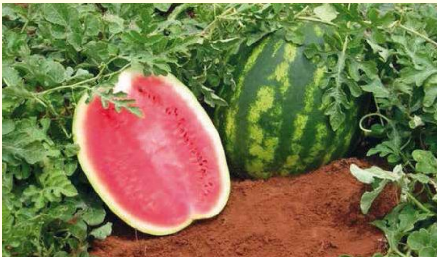
Dentre as diferentes espécies que compõem as cucurbitáceas, a melancia é a que menos tolera baixas temperaturas