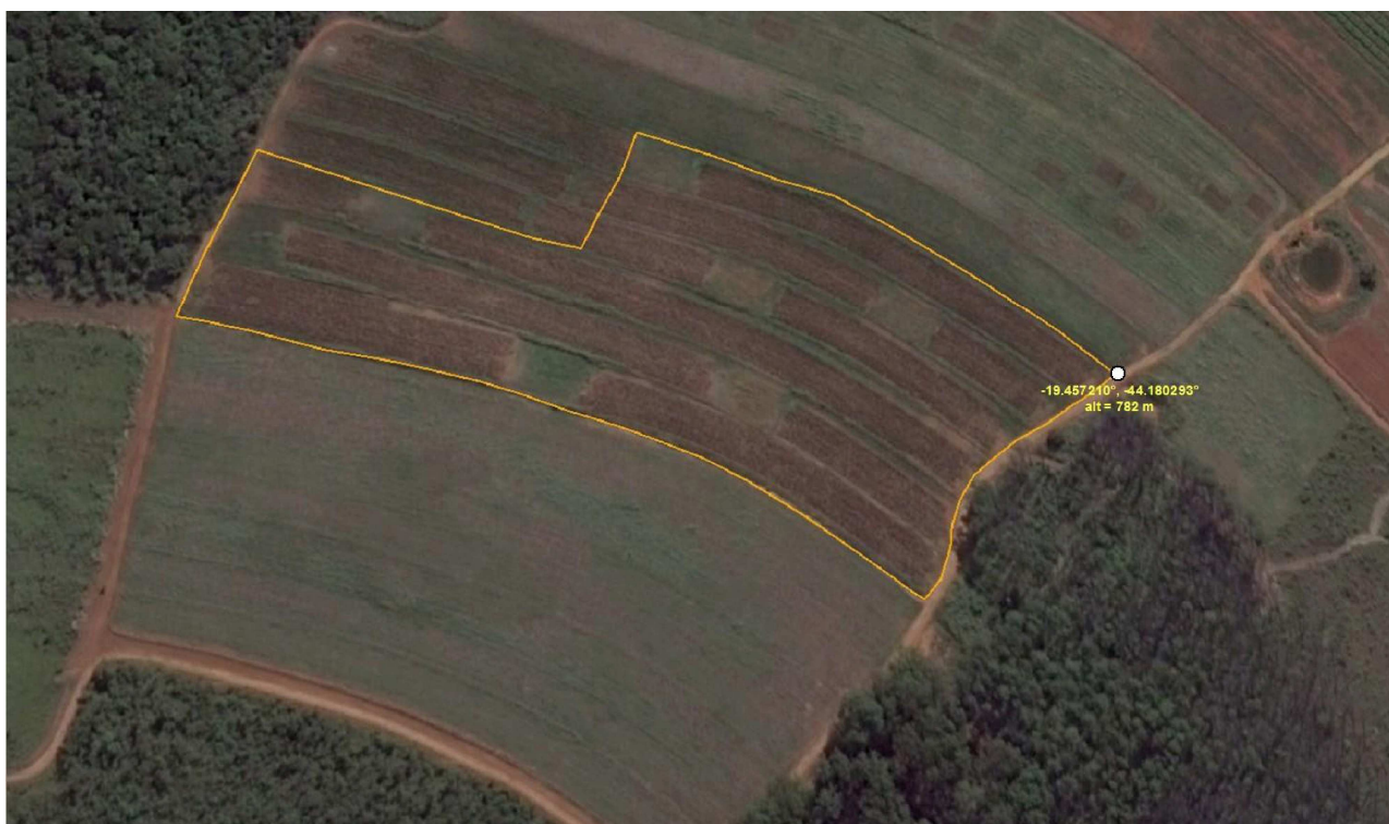
Figura 1 – Área Experimental de Manejo de Solos na Embrapa Milho e Sorgo, Sete Lagoas, MG, outubro de 2014.