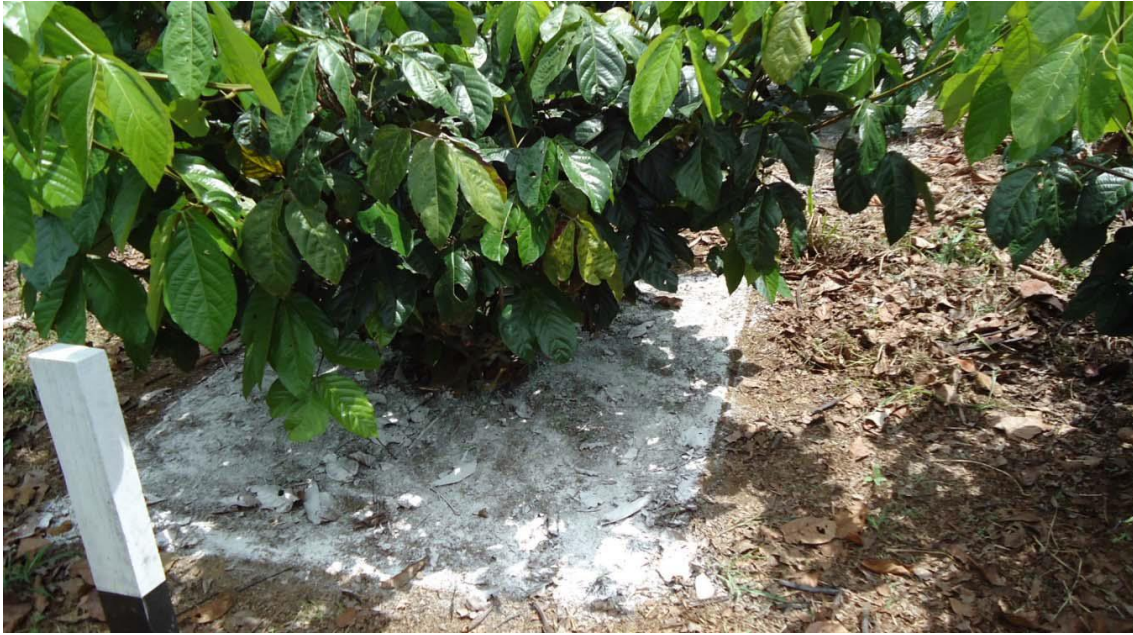
Figura 4 - Aplicação de “Calcário + Gesso” do modo localizado, em experimento conduzido pela Embrapa Amazônia Ocidental na Agropecuária Jayoro Ltda.