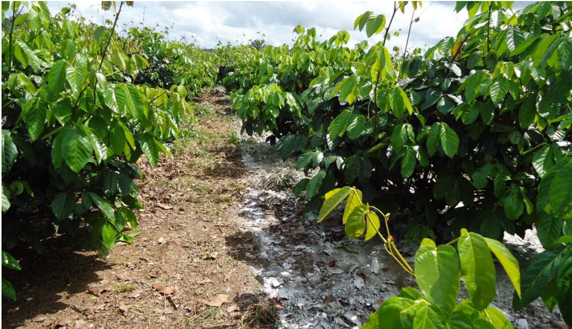
Figura 2 - Aplicação de “Calcário + Gesso” do modo à lança, em experimento conduzido pela Embrapa Amazônia Ocidental na Agropecuária Jayoro Ltda.

Para o modo de aplicação localizado do “gesso + calcário”, também houve efeito significativo da produtividade de frutos ( p < 0,01 ) ( Figura 3 ).