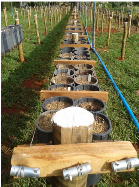
Figura 1. Linhas de plantio com estrutura suporte com estacas de eucalipto tratadas, arames liso e ripas de madeira para sustentação dos tubetes.

Foram instaladas 10 linhas com 48 m de comprimento, espaçamento entre linhas de plantio de 1,20 m. Uma estrutura suporte dos recipientes foi composta de moirões de eucalipto, espaçadas em 2 m dentro das linhas, arames galvanizado com diâmetro de 2,4 mm e ripas de madeira com finalidade de garantir maior firmeza aos arames e consequentemente aos tubetes (Figura 1).