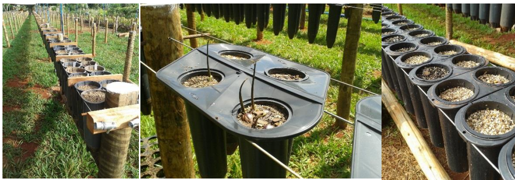
Figura 2. Tipos de tubetes utilizados para sementeira: da esquerda para direita: citrus pot, tubetes em bandeja suporte para quatro mudas e tubetes em suporte duplo.

Os tubetes utilizados apresentam diferentes capacidades para substrato, constando de tubete tipo ôcitrus potô com volume de 3L e colocados diretamente sobre os arames, dois tubetes de 900 ml, diferenciando no tipo de encaixe das bandejas suporte. Um primeiro tipo com suporte duplo (capacidade para 20 mudas por metro) e outro alocado em bandeja para quatro tubetes (capacidade para 10 mudas por metro) (Figura 2).