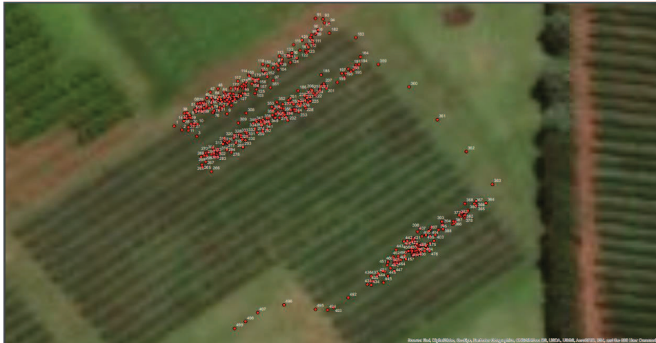
Figura 2: Pontos em que foram registrados os dados de colheita.