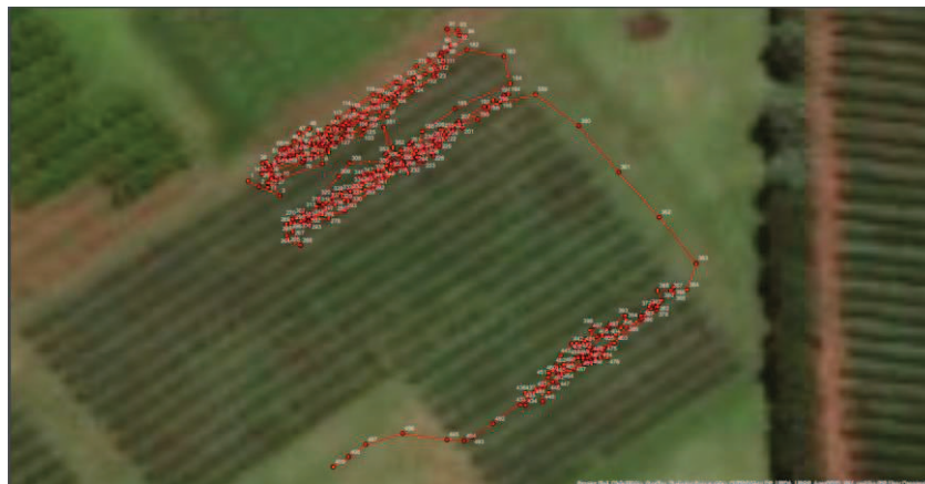
Figura 3: Mapeamento do protótipo com conexão entre os pontos de colheita e o bin de referência.

A partir dos dados obtidos, foi determinada a trajetória da colheita, entre as plantas colhidas e o esvaziamento da sacola de colheita em um bin de teste instrumentado com um sistema RFID, demonstrando os resultados conforme na Figura 3.