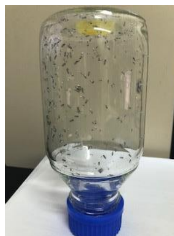
Figura 4 – Adultos de bicho-mineiro do cafeeiro coletados de sistema de criação.