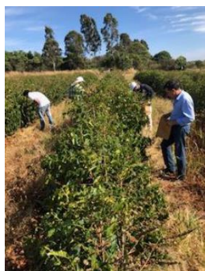
Figura 1 – Coleta a campo de folhas infestadas com bicho-mineiro do cafeeiro nas fases de ovos, larvas e crisálidas.

Neste trabalho, foram estabelecidos métodos de coleta de folhas infestadas com a praga (Figs. 1 e 2), métodos para eclosão de crisálidas e coleta de adultos em sistema fechado (Figs. 3 e 4) e método de extração de RNA (Fig. 5) em coluna de resina por afinidade.