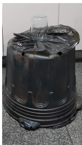
Figura 3 – Sistema de eclosão de crisálidas de bicho-mineiro do cafeeiro.

Para a extração do RNA total, foi utilizado o kit Promega ReliaPrep™ RNA Tissue Miniprep System - protocolo para tecidos fibrosos, com tratamento de DNase on column . A estimativa da quantidade e integridade do RNA foi feita por eletroforese em gel de agarose não desnaturante. A quantificação do material extraído foi feita no NanoDrop™ 2000 Thermopor espectrofotometria da absorbância a 230, 260 e 280 nm.