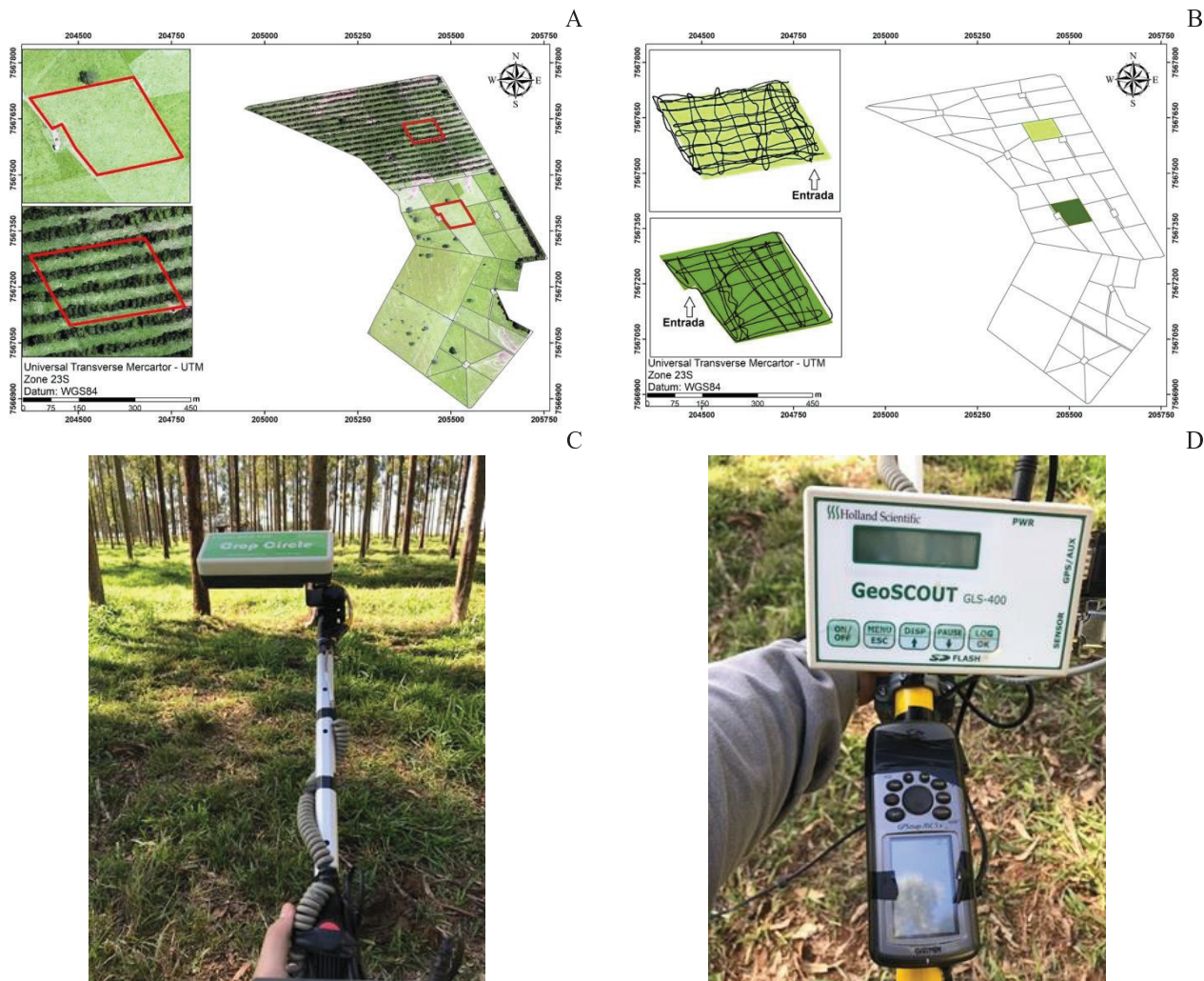
Figura 1. Área de estudo, sistema ILP e ILPF da Embrapa Pecuária Sudeste, São Carlos - SP.