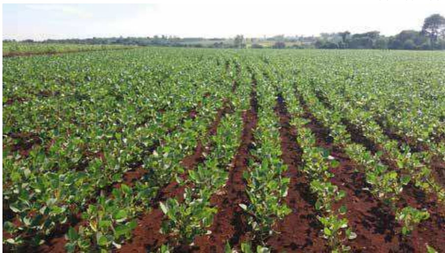
O custo de produção da soja vem aumentando ao longo das últimas safras no Brasil

cos para controle do percevejo-marrom na soja, foi desenvolvido um trabalho na Embrapa Agropecuária Oeste, em parceria com a Embrapa Soja. Para tanto, uma área total de aproximadamente três hectares foi dividida em três talhões. Todas essas áreas foram semeadas na segunda quinzena do mês de outubro e semanalmente monitoradas com a utilização do pano de batida (1m de comprimento x 0,5m de largura), sendo amostrados oito pontos em cada uma das áreas para avaliação dos níveis populacionais de percevejos. Registrou-se o número de percevejos por pano de batida, tanto de ninfas grandes (maiores do que 5mm) quanto o de adultos. Nenhuma aplicação de inseticida foi realizada para o controle de lagartas nessas áreas, considerando-se que a incidência de lagartas desfolhadoras não atingiu o nível de controle. O manejo de doenças e de plantas daninhas foi realizado de acordo com as recomendações técnicas para a soja (Reunião de Pesquisa de Soja, 2017). Por ocasião da colheita, amostras de grãos foram separadas e os índices de danos avaliados pelo teste de tetrazólio.