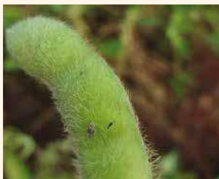
Parasitoide Telenomus podisi pode auxiliar no manejo de percevejos em soja

Com o objetivo de minimizar a necessidade de utilização de inseticidas quími-