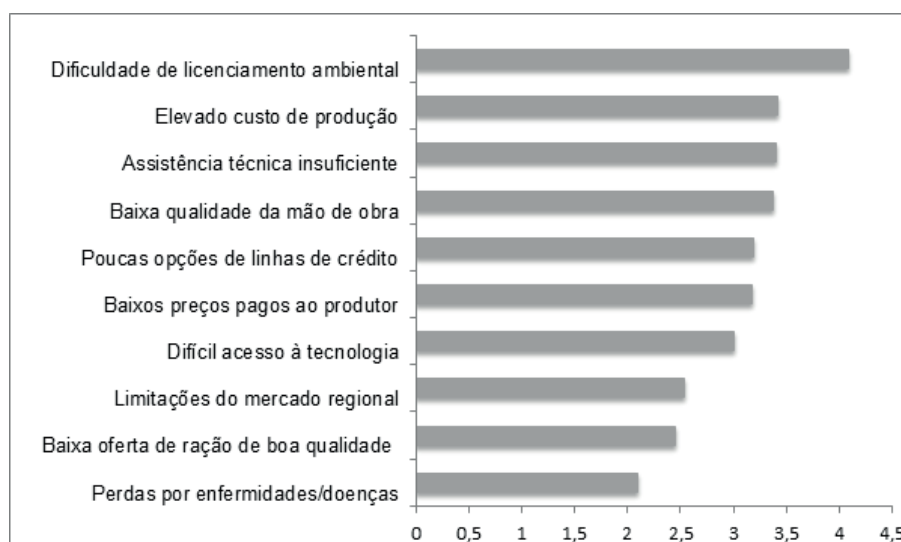
Figura 2. Classificação dos principais fatores que limitam a expansão da piscicultura

Em algumas regiões, determinados elos são mais fortes enquanto outros são mais fracos, sendo necessárias análises específicas para os diferentes locais. A nível nacional, de acordo com pesquisa realizada em 2010 pela Acqua Imagem (empresa especializada em pesquisas aquícolas) junto a 350 piscicultores do país, o principal fator limitante da expansão da piscicultura na concepção dos produtores está relacionado à dificuldade de obtenção da licença ambiental.