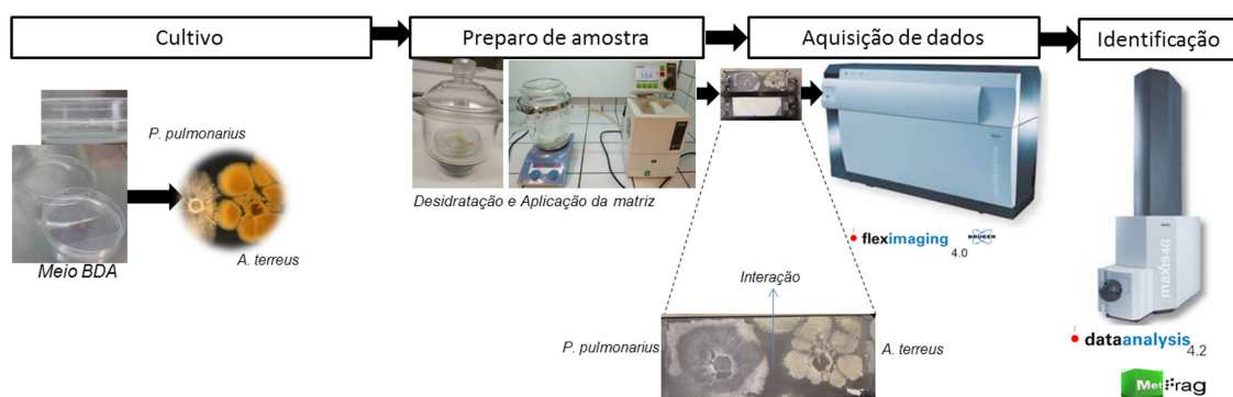
Figura 1. Esquema do procedimento experimental seguido para análise MALDI-IMS dos fungos P. pulmonarius (BRM 055674) e A. terreus (ATCC® 20542™).

A extração dos metabólitos foi realizada com metanol e a análise química foi feita por UHPLC-ESI-MS/MS para identificação em alta resolução (Prominence LC30AD, Shimadzu e Maxis 4G, Bruker Daltonics). Os padrões de fragmentação obtidos foram comparados com o banco de dados MetFrag (Rutkies et al., 2016). A metodologia empregada e descrita acima pode ser visualizada resumidamente na Figura 1.