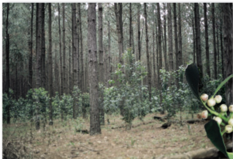
Erva-mate sob Pinus sp. (Quedas do Iguaçu, PR)