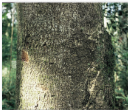
Casca externa (Colombo, PR)