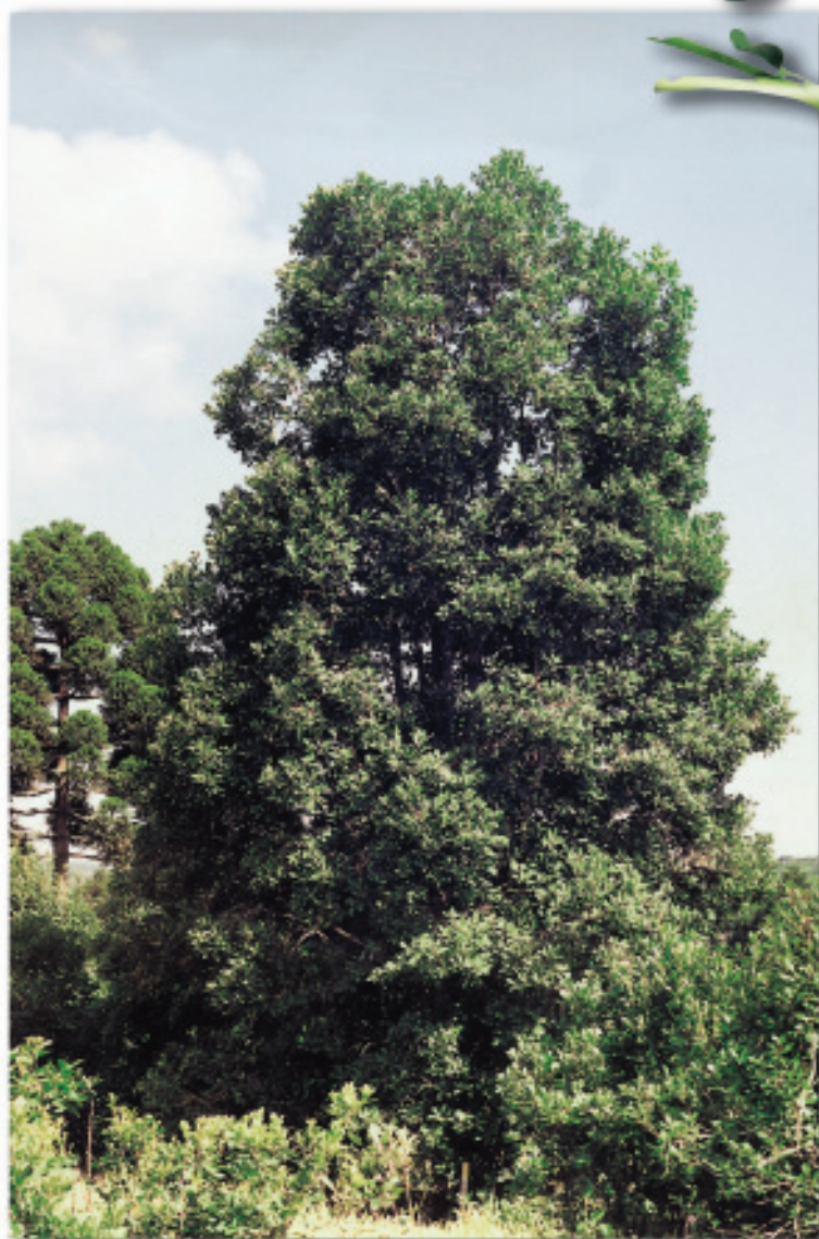
Árvore (Ivaí, PR)