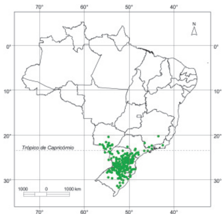
Mapa 50. Locais identificados de ocorrência natural de erva-mate ( Ilex paraguariensis ), no Brasil.

Também é encontrada de forma rara, na Floresta Ombrófila Densa (Floresta Atlântica), nas formações Alto-Montana/Montana e Montana (Roderjan, 1994), sendo provavelmente raríssima na Ilha de Santa Catarina (Klein, 1969). Apresenta ocorrência rara no Cerradão, no Estado de São Paulo (Durigan et al., 1997).