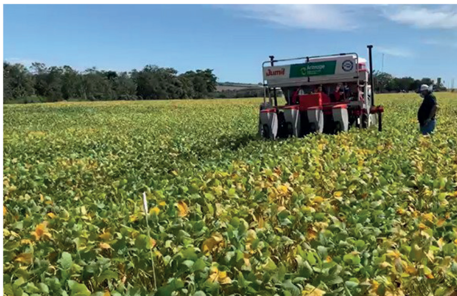
Figura 1. Estádio fenológico da soja em R_7 no momento da semeadura intercalar de milho nas entrelinhas referente ao Antecipe.

soja encontrava-se em estágio fenológico R_7 (Figura 1), correspondendo ao pleno amarelecimento das folhas e uma vagem com coloração escura na haste principal (FARIAS et al., 2007). A Figura 2 demonstra a emergência do milho no estágio V_2 em 05/03/2022, 3 dias antes da colheita da soja.