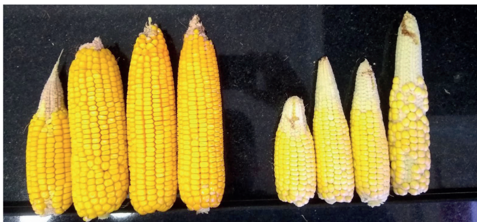
Figura 3. Detalhe das espigas provenientes do sistema Antecipe (esquerda) e milho Pós-Soja (direita).

CV: coeficiente de variação; médias seguidas de mesma letra nas colunas não diferem entre si pelo teste de Tukey a 5% de probabilidade.