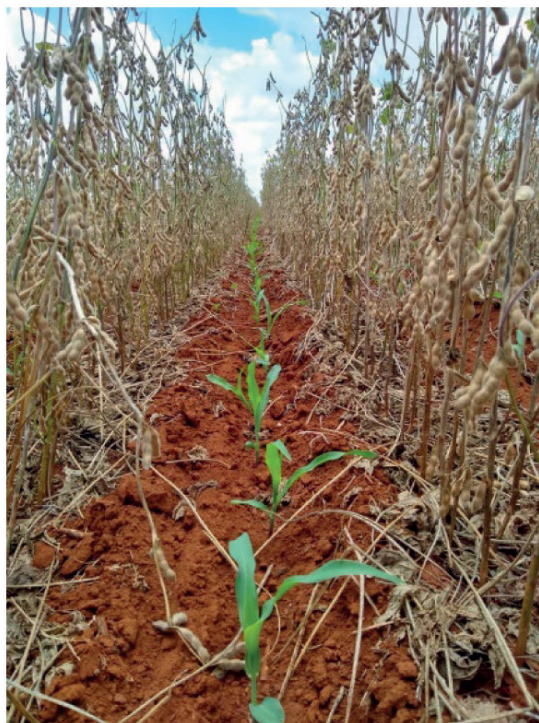
Figura 2. Milho em V2, semeado através do sistema Antecipe nas entrelinhas da soja.

O híbrido de milho utilizado nos dois tratamentos foi o AG8065 PRO3. No Sistema 1 , a densidade de sementes de milho foi regulada para 3,5 sementes m^{-1} objetivando estande final de 70.000 plantas ha^{-1} . No Sistema 2 , em razão da época de semeadura (Tabela 2), a densidade de sementes foi diminuída para 2,8 sementes m^{-1} com objetivo de obter estande final de 56.000 plantas ha^{-1} no momento da colheita.