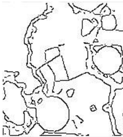
Figura 3 Bordas de Canny da imagem filtrada por difusão anisotrópica com 20 iterações (desvio padrão = 1.0).