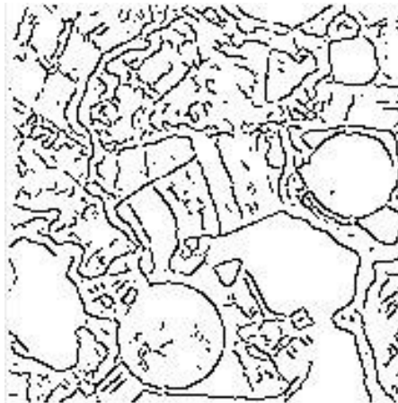
Figura 2 Bordas de Canny da imagem original (desvio padrão = 1.0).