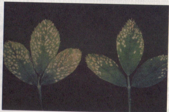
Figura 1. Sintoma de deficiência de potássio em alfafa.

Os sintomas de deficiência de potássio são típicos para a cultura da alfafa (Figura 1), podendo muitas vezes ser confundidos com sintomas de ataque de doenças.