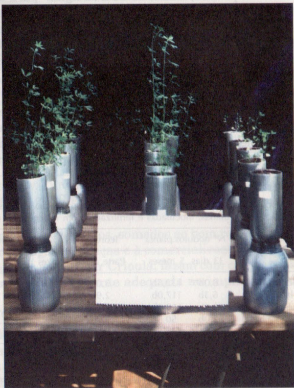
Figura 2. Efeito do uso de fungicidas de alfaça na fixação biológica de alfaça.

leiras, SEMIA 116, SEMIA 134 e SEMIA 135 e dois fungicidas, Thiram e Iprodione, encontrou incompatibilidade de uso da SEMIA 135 com o fungicida Iprodione, principalmente quando este era utilizado, além do tratamento de superfície, também como tratamento de solo, como pode ser observado na Figura 2.