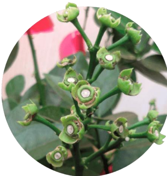
Figura 4: Sintomas da Podridão Floral.

Diferentemente do Cancro Cítrico, a podridão floral ataca os botões, as flores e nos frutos ainda novos (Gasparotto et al., 1997) (Figura 4). No estágio de crescimento dos botões florais a árvore está em seu período mais sucessível para o avanço da doença. Os períodos chuvosos ou com a ocorrência de orvalho auxiliam no desenvolvimento da patologia (Gasparotto et al., 1997).