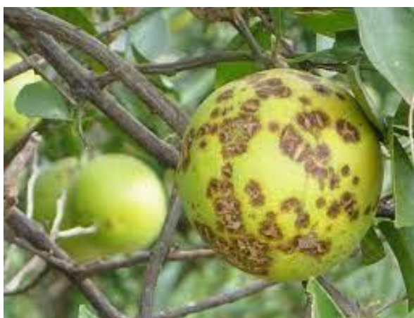
Figura 3: Sintomas Leprose do Citrus.

apresenta alta taxa de infecção, ocorre queda prematura dos frutos e definhamento dos ramos, que podem levar a planta à morte (Rossetti, 2001, apud in MARQUES et al., 2007, p.1532).”