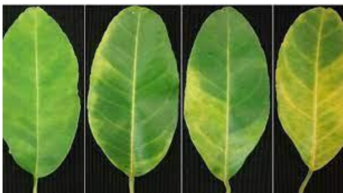
Figura 7: Evolução dos sintomas na folha.

“Plantas com HLB apresentam, geralmente, pelo menos um dos sintomas descritos a seguir. O início do aparecimento dos sintomas é caracterizado pela presença de um ou poucos ramos com folhas amareladas, geralmente em poucas plantas no pomar. Huanglongbing, o nome oficial da doença, significa, em chinês, “doença do ramo amarelo”. As folhas presentes nesses ramos perdem parte da sua coloração verde, apresentando-se parcialmente amarelas e verdes, sem uma delimitação clara entre essas duas cores. Esse tipo de sintoma é denominado “mosqueado”. Esse é o sintoma mais característico de plantas com HLB, tendo sido observado em todos os locais nos quais a doença foi descrita até hoje” (BELASQUE JR et al. 2010, p.54).