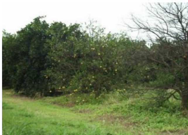
Figura 5: Estágios e sintomas da doença.

“inicialmente, folhas verde-pálidas, e sua pronunciada queda, morte apical de ramos e, ocasionalmente, desenvolvimento de pequeno número de ramos “ladrões” na copa. No estágio final, todas as folhas caem e a árvore morre, permanecendo, não raro, com alguns frutos presos aos galhos (MULLER et al., 2002).