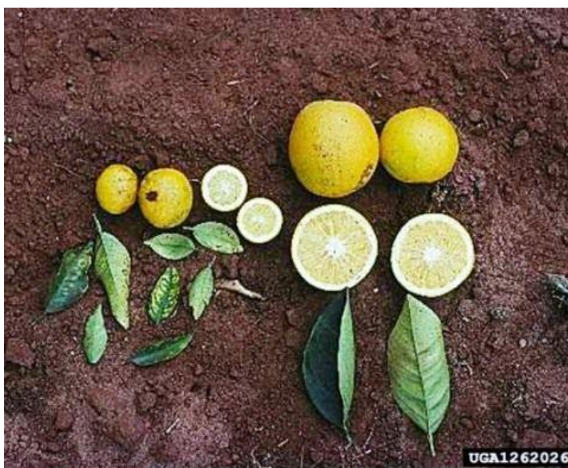
Figura 6: Sintomas da doença.

“Clorose das folhas inicialmente na parte mediana e superior da copa, tomando depois toda a planta. - Folhas com sintomas de deficiência nutricionais, mormente de zinco e carência de potássio (frutos miúdos). - Clorose variegada nas folhas mais desenvolvidas. - As manchas cloróticas da página ventral, correspondente, em folhas mais velhas, pequenas bolhosidades cor de palha na página dorsal, semelhantes a manchas devidas à toxidade de boro. A análise foliar, entretanto, mostrou que não ocorre nível de boro próximo a toxicidade. - Frutos de tamanho reduzido e endurecidos, imprestáveis para o comércio, persistentes, com amarelecimento precoce. - Em plantas muito afetadas notam-se, com bastante freqüência, galhos salientes na parte superior da copa, com folhas e frutos miúdos e alguma desfolha nos galhos ponteiros” (ATA, apud in ROSSETI; De NEGRI, 2011, p.62).