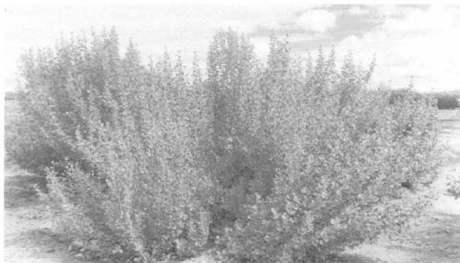
Figura 2. Atriplex nummularia irrigada com o rejeito da dessalinização de água salobra, com um ano de idade

Na Tabela 2 tem-se o peso total em matéria fresca de cada uma das parcelas colhidas de Atriplex nummularia , após um ano de idade. Por sua vez, cada parcela é constituída por 16 plantas, produzindo uma média geral de 23,4 kg de material por planta. O total de produção de todo o conjunto de plantas da área é de 4.504,0 kg, alcançando a produtividade de 26.064,0 kg ha -1 colhido, considerando-se a densidade de plantio de 1.111 plantas ha -1 .