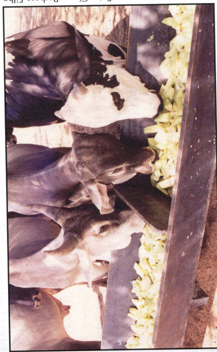
Fig. 2. Melancia-forrageira fornecida aos animais no cocho.

Vale salientar que qualquer tipo de estocagem que envolva o transporte dos frutos deve ser cuidadosamente avaliado, para não elevar muito o custo final do produto. Uma outra prática que pode ser adotada pelos produtores para diminuir os custos com o arraçoamento dos animais com melancia-forrageira na propriedade é a construção de pequenos currais, fixos ou móveis, próximos da área plantada com melancia, para onde os frutos são diariamente transportados, picados e fornecidos em cochos aos animais (Fig. 2), que permanecerão nos currais apenas durante o arraçoamento, voltando aos pastos em seguida. Finalmente, o arraçoamento de menor custo é aquele em que os frutos são simplesmente picados ou quebrados nos próprios locais onde se desenvolveram, eliminando, assim, as despesas com transporte.