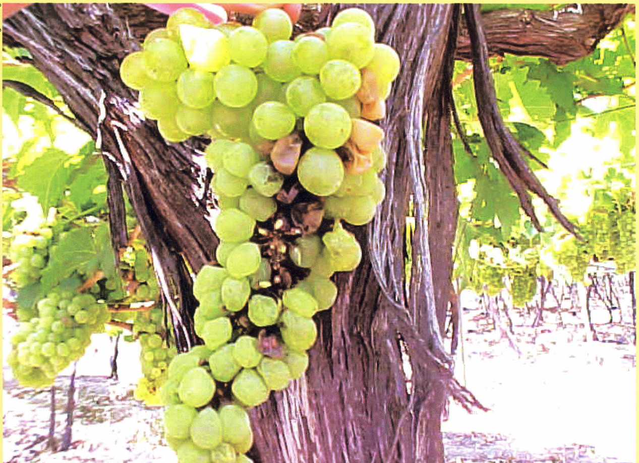
Murchamento das bagas em consequência do ataque de C. gnidiella .

Na região sul do Brasil, as lagartas passam o inverno com reduzida atividade, sob o ritidoma do caule ou sobre folhas e cachos de uvas secos que não foram retirados da planta durante a colheita. Este comportamento, entretanto, não é observado no Vale do São Francisco, pois as videiras estão em constante produção resultando na multiplicação constante da praga nos vinhedos