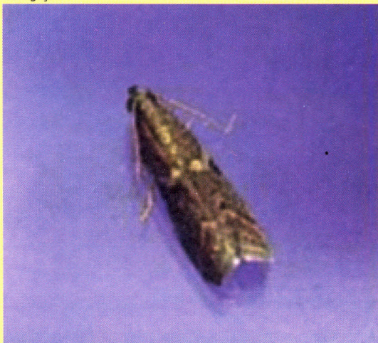
Adulto de C. gnidiella .