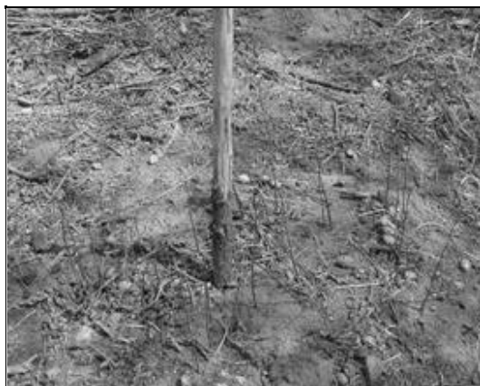
Figura 5. Plântulas de imbuzeiro ( Spondias tuberosa Arruda) no final do período chuvoso.