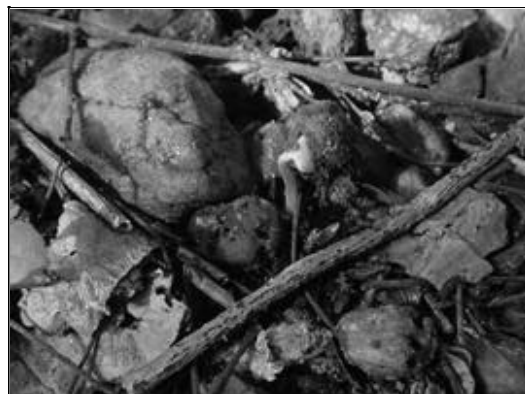
Figura 3. Início da emergência de uma plântula de imbuzeiro ( Spondias tuberosa Arruda) abaixo da copa da planta-mãe na caatinga.

Na estação chuvosa de 2004 (janeiro a julho) a precipitação pluvial acumulada foi de 800 mm (Tabela 4). Essa precipitação foi maior que dos demais anos avaliados tendo uma influência muito positiva na emergência de plântulas. Foi observada a emergência de 2.142 plântulas nas 37 plantas acompanhadas com a ocorrência de 57,89 plântulas.m 2 , em média, por planta-mãe. A