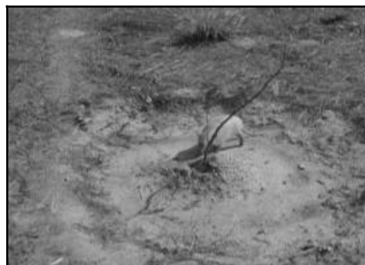
Figura 2. Tatu-peba ( Euphractus sexcinctus ) escavando o solo para consumo do xilopódio de planta de imbuzeiro ( Spondias tuberosa Arruda) na caatinga.

Neste ano, foi registrada a ocorrência de 2,39 plântulas.m -2 , em média, por planta-mãe na estação chuvosa. No final do período de estiagem, sobreviveram duas plântulas que se desenvolveram atingindo o estágio juvenil na estação chuvosa subsequente, porém, essas foram