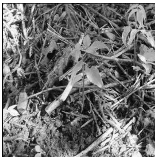
Figura 4. Plântula de imbuzeiro ( Spondias tuberosa Arruda) aos 28 dias após a emergência abaixo da copa da planta-mãe na caatinga.

plântulas consideradas mortas foram retiradas do solo as túberas nas raízes encontravam-se murchas, indicando que seus sistemas radiculares não proporcionaram condições para suportar a falta de umidade no solo.