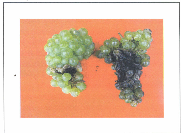
FIGURA 3. Sintomas de podridões por Aspergillus e por Fumagina em frutos na pré-colheita em vinhedos de uvas de vinhos na região semi-árida do Nordeste brasileiro no Estado de Pernambuco.

nos vinhedos de uvas para vinhos. As demais doenças comuns aos dois vinhedos, foram em menor grau de severidade no vinhedo de uvas de vinhos, quando comparadas aos conhecidos graus de ocorrências e severidade nos vinhedos de uva de mesa.