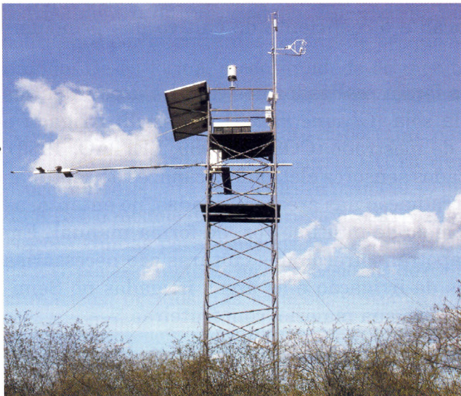
Fig. 3. Torre micrometeorológica instalada sobre a Caatinga do Semi-Árido brasileiro.