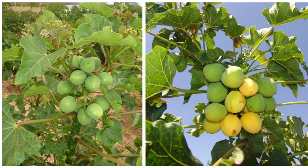
Figura 02. Floração e frutificação do pinhão manso aos quatro e cinco meses

RESULTADOS E DISCUSSÃO: Em torno de 120 dias após o plantio, as plantas apresentavam tanto floração como frutificação (Figura 02). Ao final do primeiro ano de colheita, a produção média por planta, com e sem irrigação, foi de 210 e 50 frutos, respectivamente (Tabela 01).