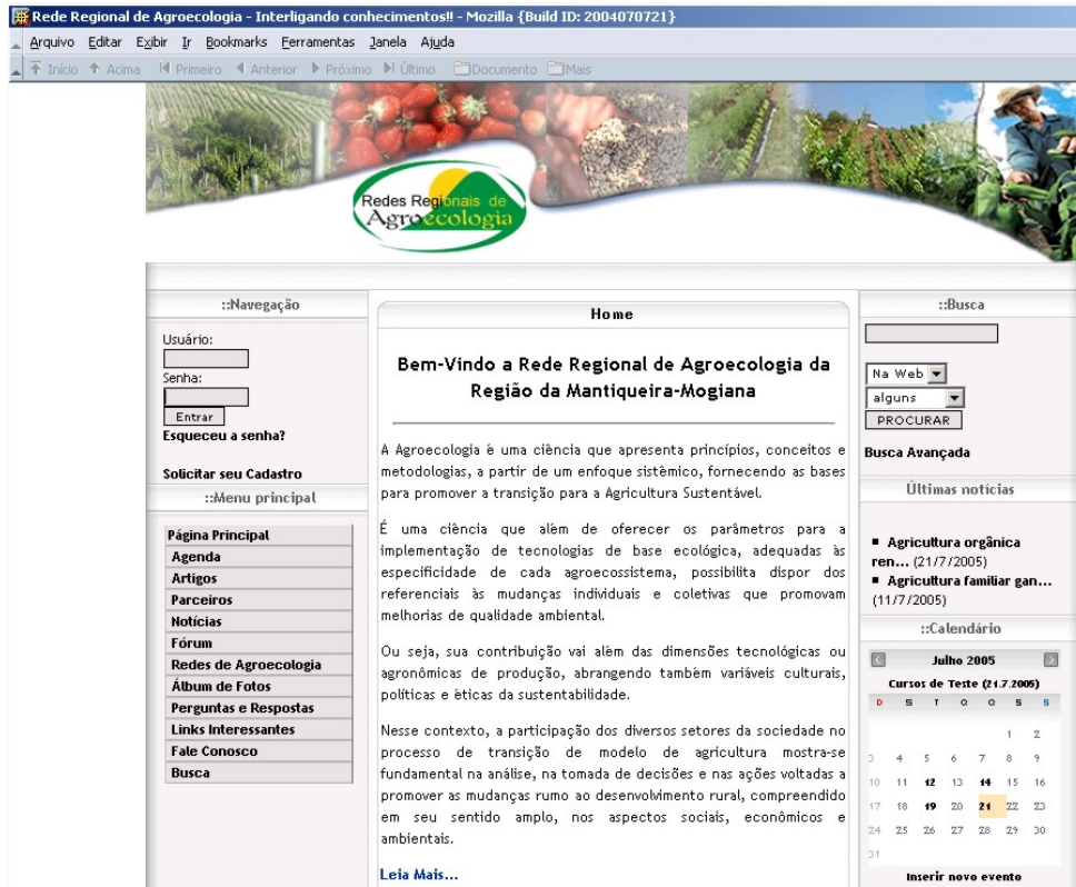
FIGURA 2 – Interface inicial da Rede Regional de Agroecologia da Região da Mantiqueira-Mogiana - SP na Web