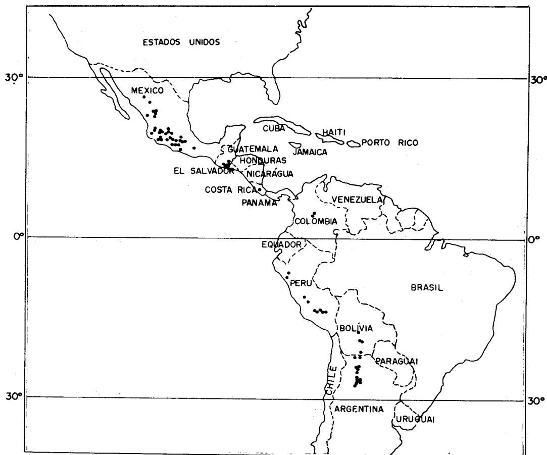
FIG. 1. Distribuição de material silvestre de Phaseolus vulgaris L. em 1988.

Como ilustração podem ser observadas, na Tabela 1, algumas características morfológicas mostrando uma tendência de continuidade ao longo da faixa de distribuição do feijão silvestre. Essas diferenças morfológicas possivelmente refletem a adaptação do feijoeiro silvestre às condições contrastantes do ambiente em que se encontra.