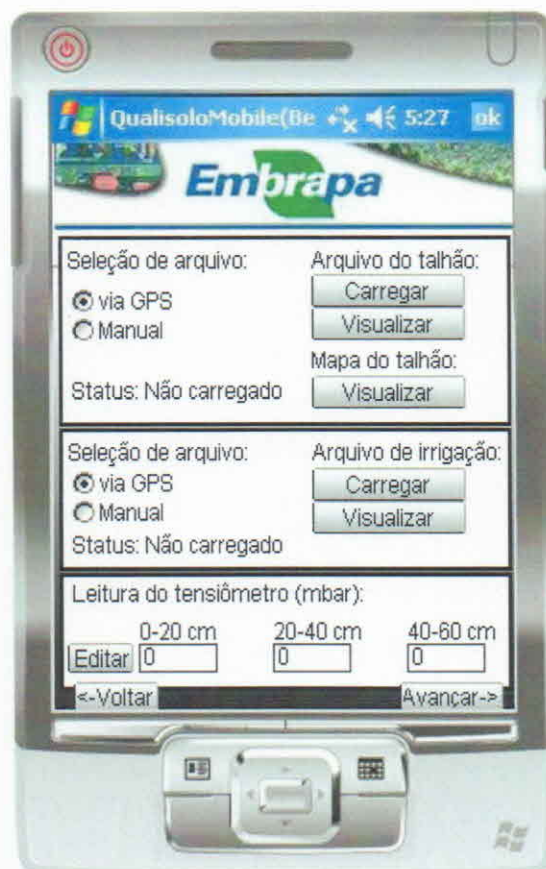
Figura 2. Janela que possibilita o carregamento automático de informações a partir do posicionamento geográfico do PDA.