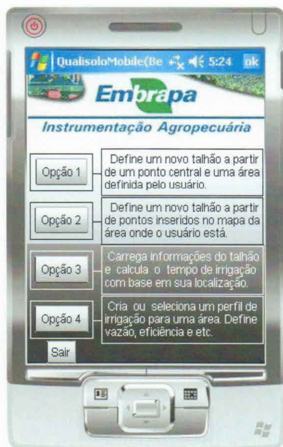
Figura 1. Janela inicial do Qualisolo Mobile, resumindo as funcionalidades que o usuário pode utilizar dentro do programa.