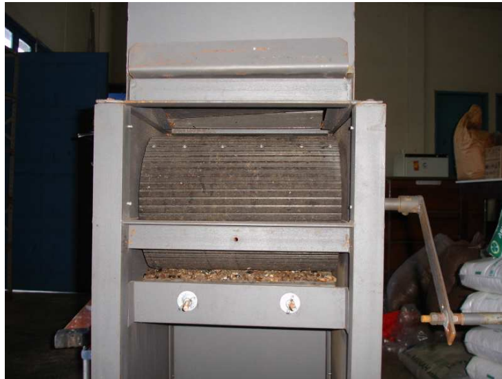
Figura 3. Vista frontal do sistema de descascamento.