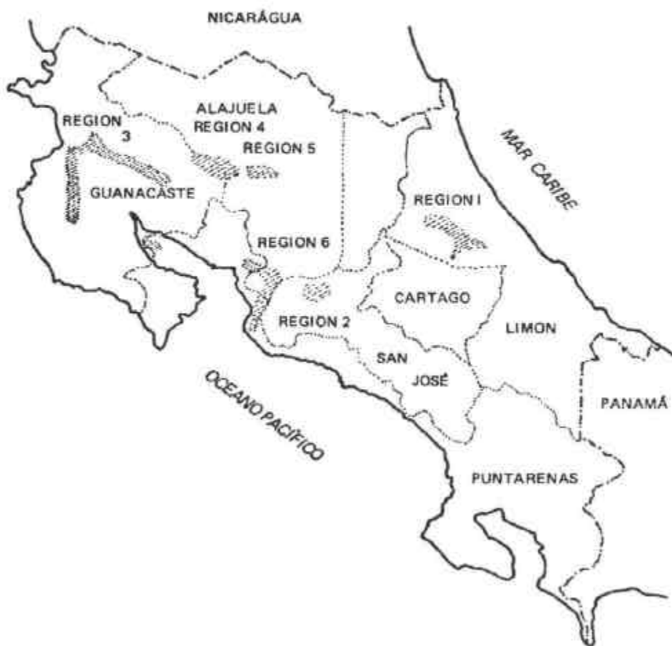
APÊNDICE 1. Mapa de Costa Rica com a localização das regiões amostradas. (Costa Rica map with the sampled regions).