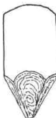
BISEL TRIPLO (Triple diagonal)