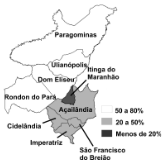
Figura 3 – Percentual de remanescentes de floresta disponível para manutenção de reserva legal por município.

Observa-se, no Quadro 2, que somente o município de Imperatriz apresenta uma parcela, e muito pequena, de seu território em área de Cerrado e que o percentual de remanescentes de Cerrado se aproxima do mínimo estabelecido pela legislação para manutenção de reserva legal (35%).