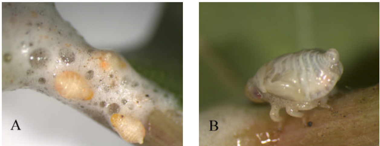
Fig. 2 - Clastoptera sp. A. Grupo de ninfas envolvidas pela massa de espuma; B. Ninfa se alimentando junto aos ramos da videira.