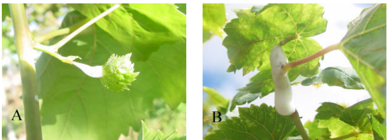
Fig. 3 - Caracterização dos danos e sintomas do ataque de Clastoptera sp. em pecíolos de ramos jovens (A) e velhos de videira (B), variedade "Itália".